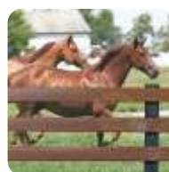
CERCAS E MOURÕES