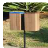
LIXEIRAS E COLETORES