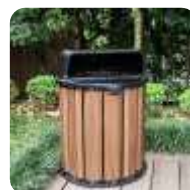
LIXEIRAS E COLETORES