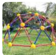
BRINQUEDOS DE AÇO