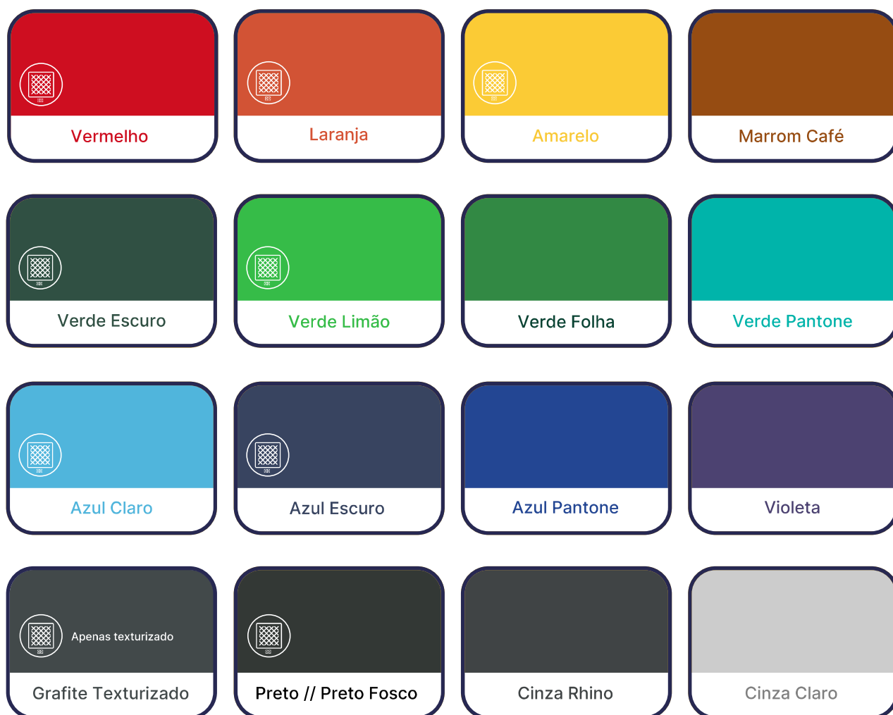
TABELA DE CORES - Somente conforme abaixo

*Cores podem variar de acordo com o monitor.